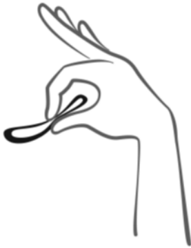
Figura 2 Presione el anillo