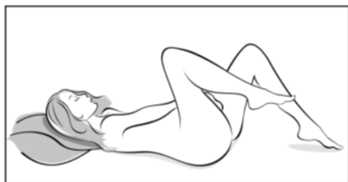
Figura 3 Escoja una posición cómoda para ponerse el anillo