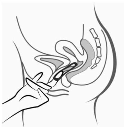
Figura 5: Ornibel puede retirarse enganchando el anillo con el dedo índice o sujetando entre el índice y el dedo medio y estirando hacia fuera.

Póngase el anillo en la vagina con una mano (Figura 4A), si es necesario separe los labios de la vagina con la otra. Empuje el anillo al interior de la vagina hasta que lo sienta cómodo (Figura 4B). Deje el anillo en la vagina durante 3 semanas (Figura 4C).